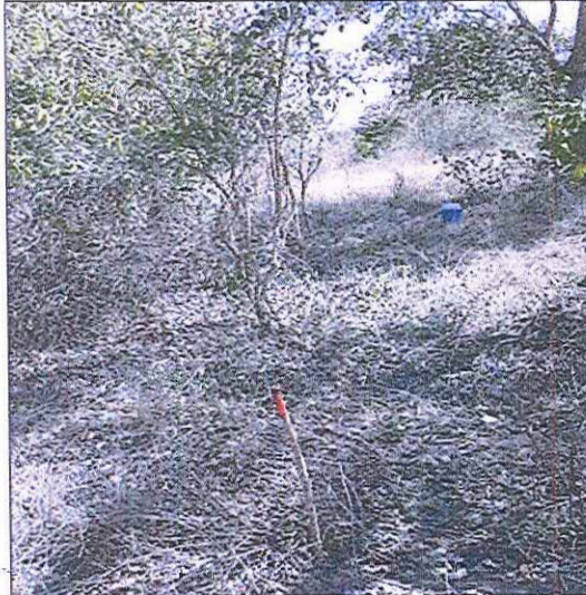
Demarcación área para traslado de cercos.