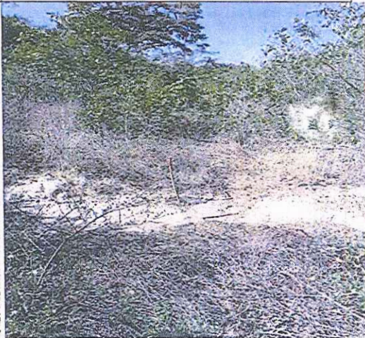
Demarcación área para traslado de cercos.