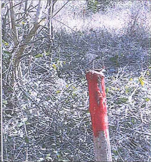
Demarcación área para traslado de cercos.