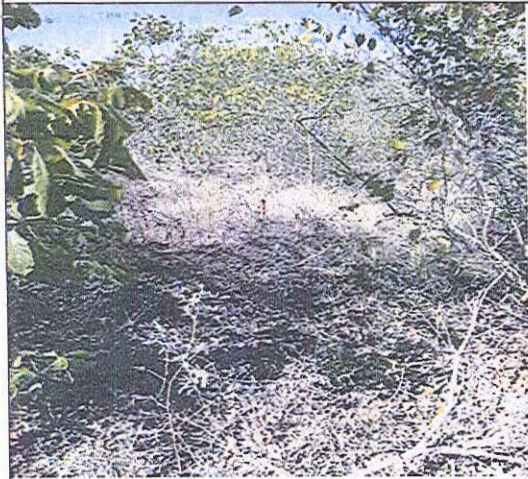
Demarcación área para traslado de cercos.